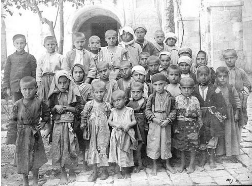
Resim: Tehcirden sonra Kudüs'e götürülmüş yetimler