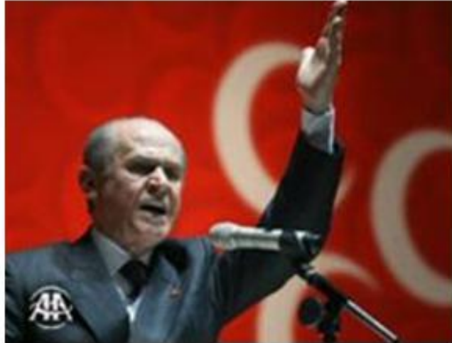
Türkiye'nin en sempatik lideri Bahçeli

Dündar'a bizzat anlattığına göre 1978'de Bahçeli beyaz Renault'sunu ülkücü gençlere ödünç vermiş ve aracın bagajındaki portakal sandığından 2 makineli tüfek çıkmış. Konu, Adana MHP davasında gündeme gelmiş ama Bahçeli'nin ifadesi alınmamış bile. 12 Eylül'de hemen bütün siyasi dernekler kapatılırken Bahçeli'nin Üniversite Akademi ve Yüksekokullar Asistanları Derneği'ne dokunulmamış.