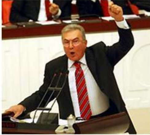
Türkiye'nin en beyefendi lideri Baykal

Yaşamak için başkalarını manipüle etmek, aldatmak ve başarmak için gereken her şeyi yapmak psikopat liderler için son derecede normal. Bu tip siyasetçiler şüpheli, gizli kapaklı ve hatta kanunlara aykırı davranışlarda bulunabiliyorlar, çünkü kuralların kendileri için geçerli olmadığına inanıyorlar. Toplumla ilişkileri hastalık derecesinde bozuk olan bu kimseler genelde diğer insanları tehditlerle yada saldırgan yaklaşımlarla korkuturlar. Her hangi bir rekabet, yasal otorite karşısında aşırı öfkelenebilirler.